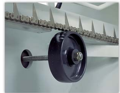
图四：特制链条刺架